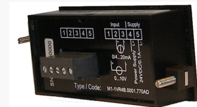
Versorgung 24 VDC