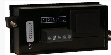
Versorgung 230 VAC